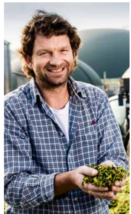
Unsere neue Seite zu Biogas finden Sie bei unsere-bauern.de unter Erzeugnisse / Biogas.

Neben der Optimierung bestehender Inhalte haben wir in diesem Jahr auch einige neue Seiten an den Start gebracht. Dazu gehört unsere Seite zur Agrartechnik. Für Laien leicht verständlich erklärt sie die wichtigsten Landmaschinen, die der Bevölkerung auf den Straßen und Feldern im Freistaat begegnen. Ebenfalls neu: die umfangreiche Seite zum Klimaschutz in der Milchwirtschaft sowie eine ebenso ausführliche Seite zum Biogas. Nachdem das Thema Biogas die Gemüter immer wieder erhitzt, wird uns diese Seite auch im Community Management sehr nützlich sein.