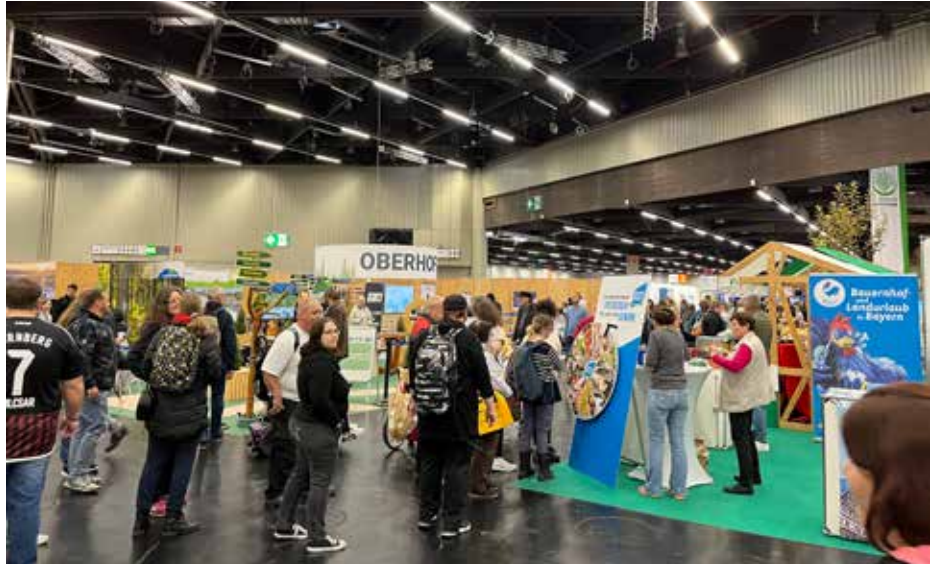
Auch auf der Consumenta, Bayerns größter Verbrauchermesse, waren wir vertreten.

Wo UBB nicht persönlich spricht, gelangen unsere Botschaften dennoch in die Öffentlichkeit. Landfrauen und andere Organisationen verteilen unsere Werbemittel zum Beispiel auf der Oberlandmesse und vielen weiteren Veranstaltungen. Besonders beliebt: die Wissensräder von UBB. Das Quiz mit kleinen Geschenken zieht viele Besucherinnen und Besucher an den Stand und bietet einen idealen Gesprächseinstieg zum Thema Landwirtschaft.