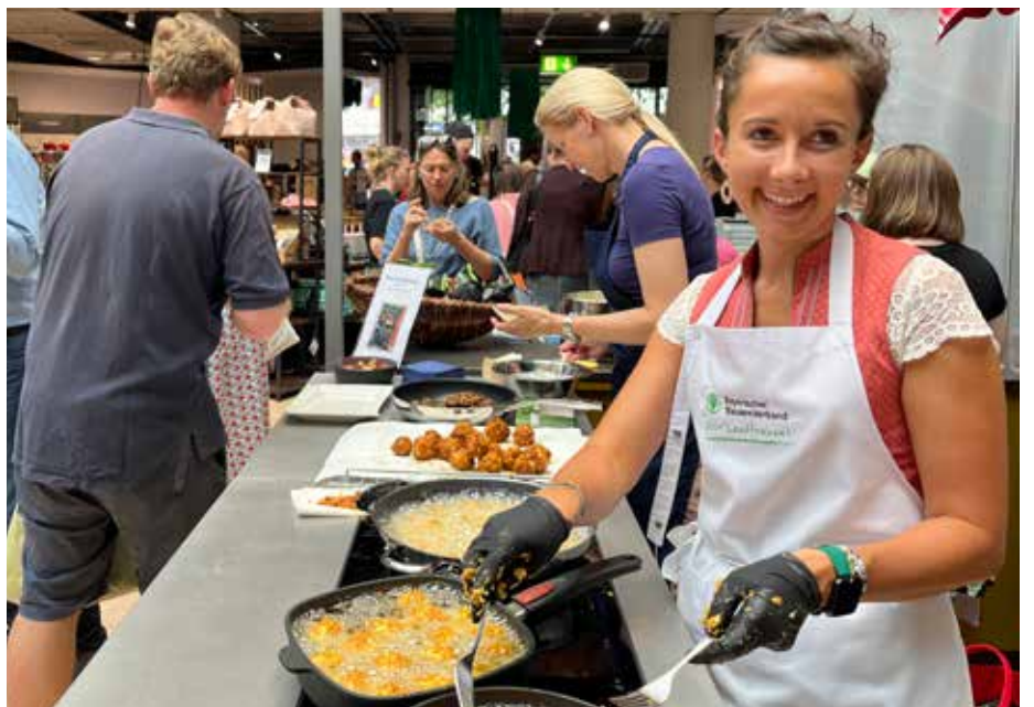
Unser Stand bei „Kustermann“ in München war stets umlagert.