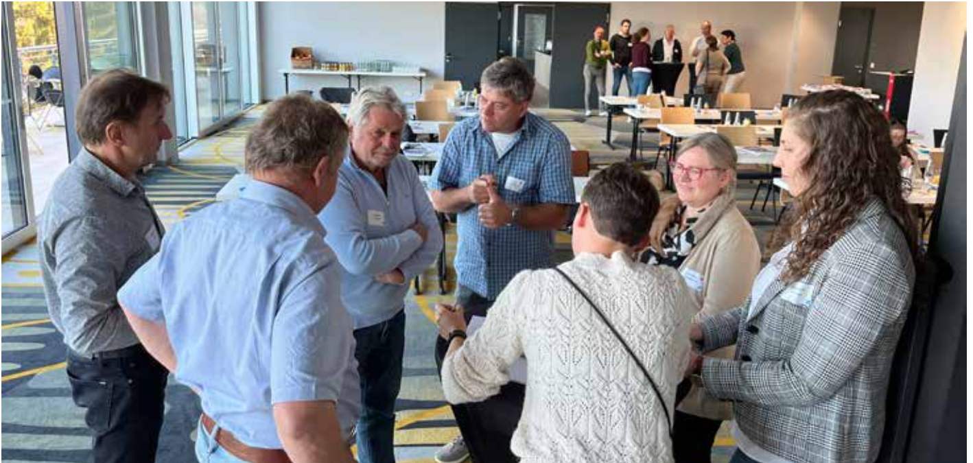
Bei unserem Workshop trainierten UBB-Mitglieder ihre Fähigkeiten im digitalen Dialog.