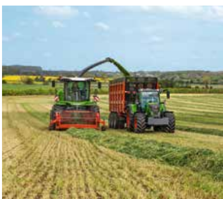
Unsere neue Seite zur Agrartechnik finden Sie bei unsere-bauern.de unter Landwirtschaft in Bayern / Agrartechnik.

Bei der Erfassung unserer Besucherzahlen standen wir in diesem Jahr vor besonderen Herausforderungen. Durch eine Datenschutz-Umstellung konnten wir von März bis Juli 2024 nur 10 Prozent unserer tatsächlichen Seitenaufrufe erfassen. Doch